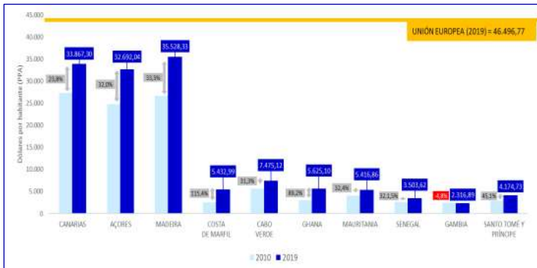
EVOLUCIÓN DEL PIB PER CÁPITA EN RELACIÓN CON LA MEDIA DE LA UE -27

Sentar las bases de un modelo de desarrollo económico y social sostenible es el principal desafío de la zona de cooperación. El espacio se caracteriza por una presencia mayoritaria de pequeñas y medianas empresas y con una elevada concentración en un reducido número de sectores económicos, lo cual aumenta su vulnerabilidad frente a las crisis económicas y reduce su resiliencia.